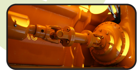
▶ Turbo embrague