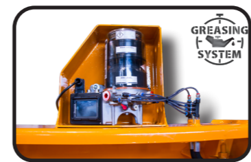
▶ Engrase centralizado