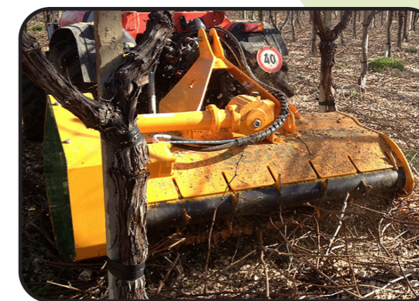
▶ Anterior o posterior