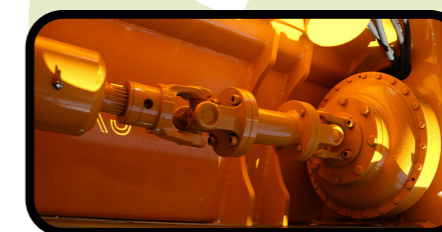
▶ Turbo embrague