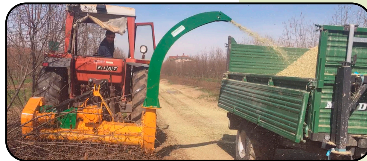
▶ Tobera alta