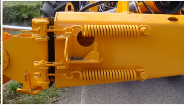
Sistema de seguridad