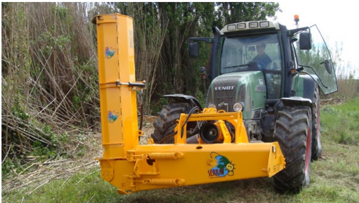
Angulación +90° -60°