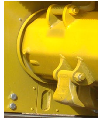
Obturaciones anti-lambres en rotor